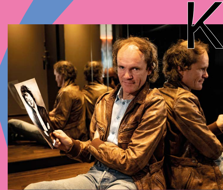
ab 12. Juni im Programmkino: Olaf Jagger